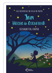
JUM HECHO DE OSCURIDAD GNONE, ELISABETTA