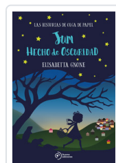
JUM HECHO DE OSCURIDAD GNONE, ELISABETTA