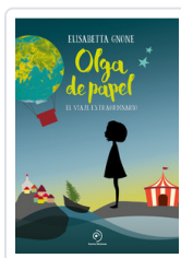
OLGA DE PAPEL GNONE, ELISABETTA