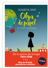
OLGA DE PAPEL - OFERTA- GNONE, ELISABETTA