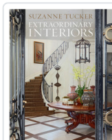
EXTRAORDINARY INTERIORS TUCKER, SUZANNE