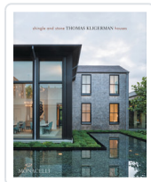
SHINGLE AND STONE. THOMAS KLIGERMAN HOUSES KLIGERMAN, THOMAS