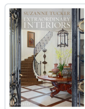
EXTRAORDINARY INTERIORS TUCKER, SUZANNE