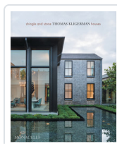
SHINGLE AND STONE. THOMAS KLIGERMAN HOUSES KLIGERMAN, THOMAS