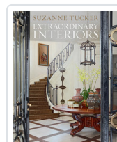
EXTRAORDINARY INTERIORS TUCKER, SUZANNE