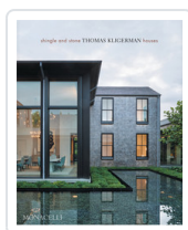
SHINGLE AND STONE. THOMAS KLIGERMAN HOUSES KLIGERMAN, THOMAS