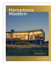
HAMPTONS MODERN. CONTEMPORARY LIVING ON THE EAST END SOKOL, DAVID