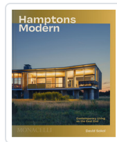
HAMPTONS MODERN. CONTEMPORARY LIVING ON THE EAST END. SOKOL, DAVID