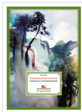
CONVERSACIONES CON POETAS EIRE, ANA