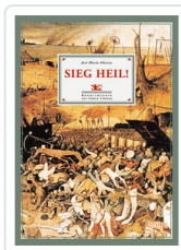
SIEG HEIL ALVAREZ, JOSE M a