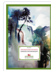
CONVERSACIONES CON POETAS EIRE, ANA