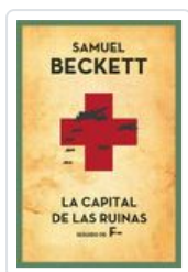
CAPITAL DE LAS RUINAS BECKETT, SAMUEL