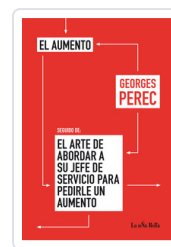
AUMENTO / ARTE DE ABORDAR PEREC, GEORGES