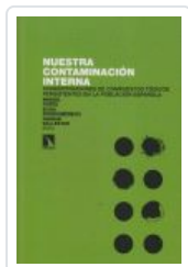
NUESTRA CONTAMINACION INTERNA PORTA, MIQUEL