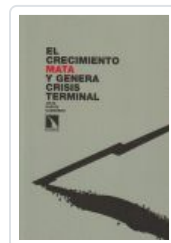
EL CRECIMIENTO MATA Y GENERA CRISIS TERMINAL GARCIA, JULIO