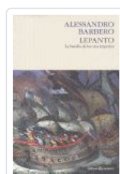
LEPANTO BATALLA TRES IMPERIOS BARBERO, ALESSANDRO