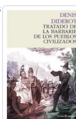
TRATADO BARBARIE PUEBLOS CIVILIZADOS DIDEROT, DENIS