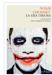
ERA OBAMA, LA CHOMSKY, NOAM