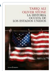
HISTORIA OCULTA DE ESTADOS UNIDOS ALI, TARIQ / STONE, O.