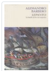
LEPANTO BATALLA TRES IMPERIOS BARBERO, ALESSANDRO