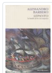
LEPANTO BATALLA TRES IMPERIOS BARBERO, ALESSANDRO