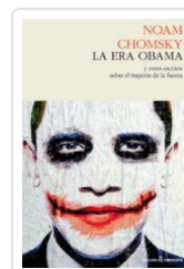
ERA OBAMA, LA CHOMSKY, NOAM