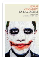
ERA OBAMA, LA CHOMSKY, NOAM