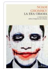
ERA OBAMA, LA CHOMSKY, NOAM