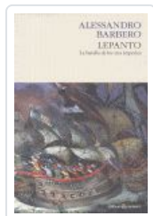
LEPANTO BATALLA TRES IMPERIOS BARBERO, ALESSANDRO