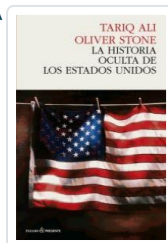
HISTORIA OCULTA DE ESTADOS UNIDOS ALI, TARIQ / STONE, O.