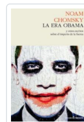
ERA OBAMA, LA CHOMSKY, NOAM