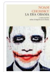
ERA OBAMA, LA ERA OBAMA CHOMSKY, NOAM