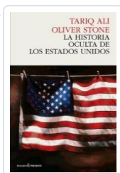
HISTORIA OCULTA DE ESTADOS UNIDOS ALI, TARIQ / STONE, O.