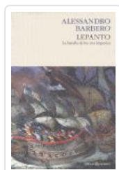
LEPANTO BATALLA TRES IMPERIOS BARBERO, ALESSANDRO