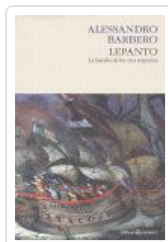
LEPANTO BATALLA TRES IMPERIOS BARBERO, ALESSANDRO