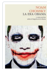
ERA OBAMA, LA CHOMSKY, NOAM