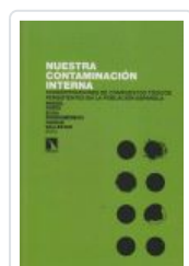
NUESTRA CONTAMINACION INTERNA PORTA, MIQUEL