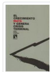
EL CRECIMIENTO MATA Y GENERA CRISIS TERMINAL GARCIA, JULIO