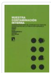
NUESTRA CONTAMINACION INTERNA PORTA, MIQUEL