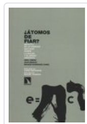
ATOMOS DE FIAR BENACH, JOAN