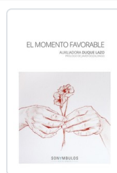
MOMENTO FAVORABLE, EL DUQUE, AUXILIADORA