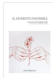
MOMENTO FAVORABLE, EL DUQUE, AUXILIADORA