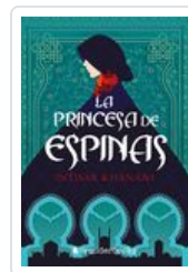
PRINCESA DE ESPINAS, LA KHANANI, INTISAR