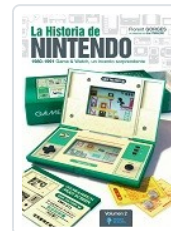
HISTORIA NINTENDO, 2 GORGES, FLORENT