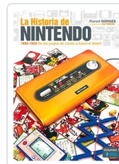
HISTORIA NINTENDO, 1 GORGES, FLORENT