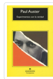
### EXPERIMENTOS CON LA VERDAD -CM AUSTER, PAUL