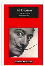
VIDA DESAFORADA DE SALVADOR DALI -C GIBSON, IAN