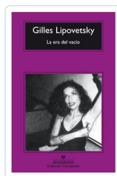
ERA DEL VACIO, LA -COMP- LIPOVETSKY, GILLES