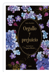
ORGULLO Y PREJUICIO (EL JARDIN SECRETO) AUSTEN, JANE