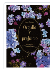
ORGULLO Y PREJUICIO (EL JARDIN SECRETO) AUSTEN, JANE