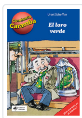
COMISARIO CARAMBA, 4 LORO VERDE SCHEFFLER, URSEL