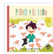
PEDRO Y EL LOBO (EL PASTOR MENTIROSO) AA.VV.