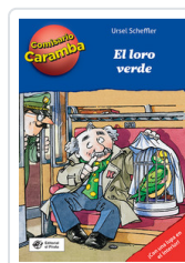
COMISARIO CARAMBA, 4 LORO VERDE SCHEFFLER, URSEL