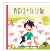
PEDRO Y EL LOBO (EL PASTOR MENTIROSO) AA.VV.