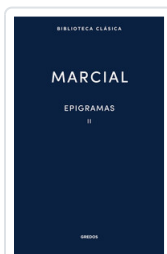
EPIGRAMAS II MARCIAL