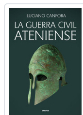
GUERRA CIVIL ATENIENSE, LA CANFORA, LUCIANO