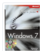
WINDOWS 7 JOAN PREPPERNAU