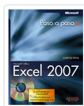
EXCEL 2007 CURTIS FRYE