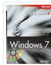
WINDOWS 7 JOAN PREPPERNAU