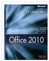
OFFICE 2010 ED BOTT