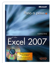
EXCEL 2007 CURTIS FRYE