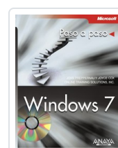
WINDOWS 7 JOAN PREPPERNAU