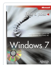
WINDOWS 7 JOAN PREPPERNAU