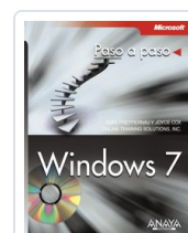
WINDOWS 7 JOAN PREPPERNAU