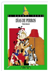
DIAS DE PERROS VIOLETA MONREAL