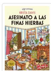
ASESINATO A LAS FINAS HIERBAS (COZY MYSTERY) DAVIS, KRISTA