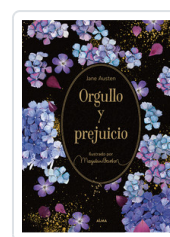
ORGULLO Y PREJUICIO (EL JARDIN SECRETO) AUSTEN, JANE