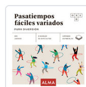
PASATIEMPOS FÁCILES VARIADOS. PURA DIVERSION SESE, MIQUEL