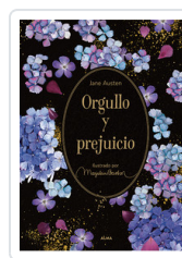
ORGULLO Y PREJUICIO (EL JARDIN SECRETO) AUSTEN, JANE