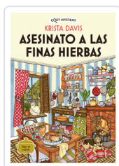
ASESINATO A LAS FINAS HIERBAS (COZY MYSTERY) DAVIS, KRISTA