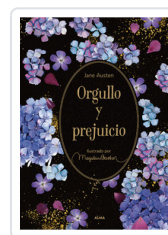
ORGULLO Y PREJUICIO (EL JARDIN SECRETO) AUSTEN, JANE