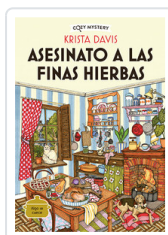
ASESINATO A LAS FINAS HIERBAS (COZY MYSTERY) DAVIS, KRISTA