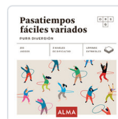
PASATIEMPOS FACILES VARIADOS. PURA DIVERSION SESE, MIQUEL