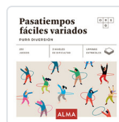
PASATIEMPOS FÁCILES VARIADOS. PURA DIVERSION SESE, MIQUEL