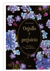
ORGULLO Y PREJUICIO (EL JARDIN SECRETO) AUSTEN, JANE