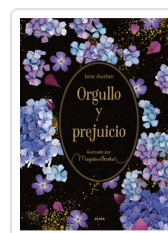
ORGULLO Y PREJUICIO (EL JARDIN SECRETO) AUSTEN, JANE