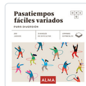
PASATIEMPOS FACILES VARIADOS. PURA DIVERSION SESE, MIQUEL