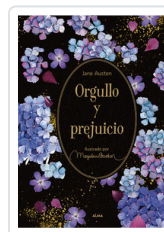
ORGULLO Y PREJUICIO (EL JARDIN SECRETO) AUSTEN, JANE