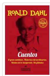
CUENTOS -DAHL- DAHL, ROALD