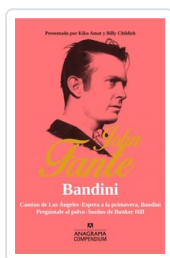
BANDINI FANTE, JOHN