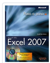
EXCEL 2007 CURTIS FRYE