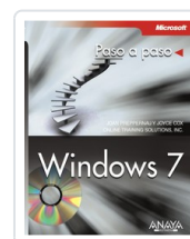
WINDOWS 7 JOAN PREPPERNAU