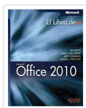
OFFICE 2010 ED BOTT