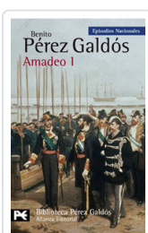
AMADEO I BENITO PEREZ GALDOS