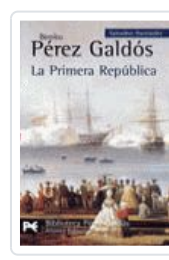
PRIMERA REPUBLICA BENITO PEREZ GALDOS